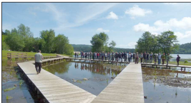
L'inauguration de la zone humide d'Aydat

Le contrat rivière qui avait été signé en 2005 avait pour but de protéger le milieu aquatique du bassin versant de la Veyre et donc de la Monne. Dans le cadre de ce contrat de nombreuses actions ont été menées à bien dont, la plus emblématique, visible par le public, est l'aménagement de la zone humide d'Aydat visant à limiter l'eutrophisation du lac. Le contrat rivière étant