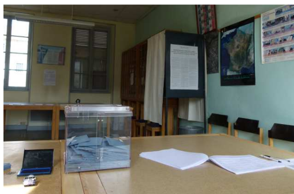
Le bureau de vote d'Olloix