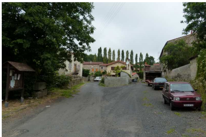
La place de la Charreyrade

Les travaux d'aménagement de la Place de la Charreyrade sont toujours le programme prioritaire retenu par l'équipe municipale.