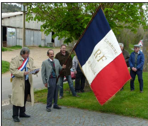
La lecture de l'allocution par M. le Maire

C'est par un temps maussade qu'au monument aux morts a eu lieu, la traditionnelle cérémonie commémorant l'armistice du 8 mai 1945. ; après avoir écouté l'allocution du Ministre Gérard Longuet, dans la bouche de notre maire, tout le monde s'est retrouvé au préau pour le pot de l'amitié.