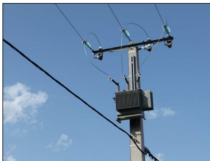
Le transformateur de la Croze

Nous n'avons par contre aucune information concernant les dates prévues pour le démontage de l'ancienne ligne, sur le territoire communal.