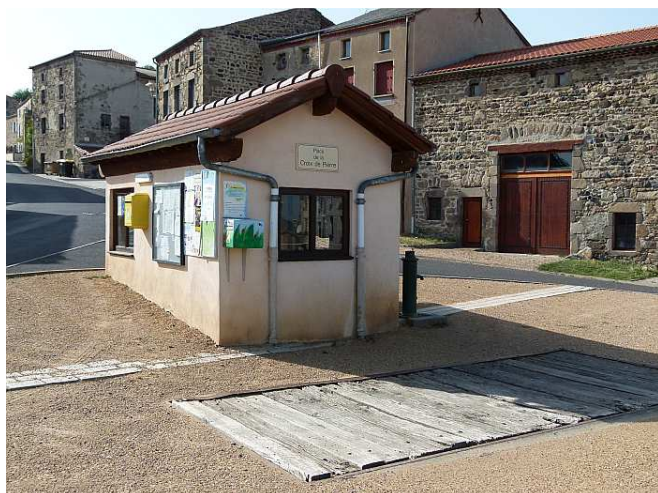
La bascule de la place de la croix de Pierre

Comme toutes les communes rurales, Olloix disposait d'une bascule municipale dont l'usage était payant. La régie instituée le 31/12/1985 pour la gestion de pesage à la bascule du fond d'Olloix n'a jamais été supprimée. Or, cette bascule n'étant plus adaptée et plus du tout utilisée, cette régie municipale n'a plus d'intérêt. Le conseil municipal, après délibération, à l'unanimité, décide donc la clôture de cette régie.