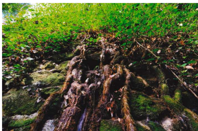
Etienne de Suzanne : Enraciné dans la pierre