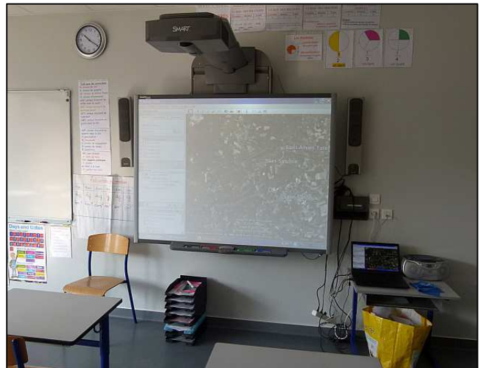
Le tableau électronique

L'école de la Monne fait partie des écoles retenues dans le cadre de l'opération "école numérique rurale" (Le plan de développement du numérique dans les écoles rurales a permis l'équipement de près de 7 000 écoles situées dans les communes de moins de 2 000 habitants.) Elle dispose donc d'un matériel informatique moderne et, en particulier, d'un tableau électronique interactif.