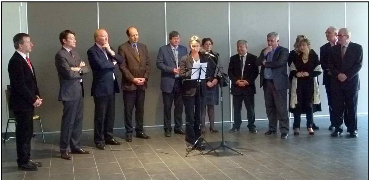
L'inauguration de l'école de la Monne

Le samedi 3 mars 2012 ce groupe scolaire a été officiellement inauguré en présence de très nombreuses personnalités.