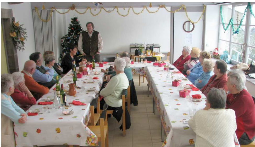
Le repas de Noël du club

Le club des Trois Puys, qui se réunit un jeudi sur deux, a repris ses activités le jeudi 11 septembre 2008. Tous les membres ont apprécié le confort apporté par l'aménagement de la salle du préau.