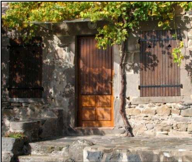
La maison à la treille

Cette activité viticole s'est peu à peu arrêtée à la fin des années 1950, le manque de chaleur, malgré la chaptalisation, ne permettant de produire qu'une piquette faiblement alcoolisée. Le vin d'Olloix n'a pas laissé le souvenir d'un nectar méritant qu'on le fasse revivre. A Liauzun on peut encore observer quelques ceps de vigne redevenus sauvages. Chaque année à l'automne, en façade de la maison située à côté de la mairie, une treille fournit des raisins assez sucrés.