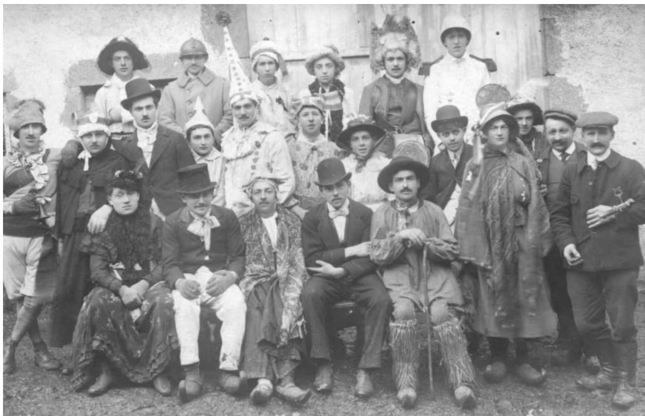
Le Mardi gras à Olloix en 1923