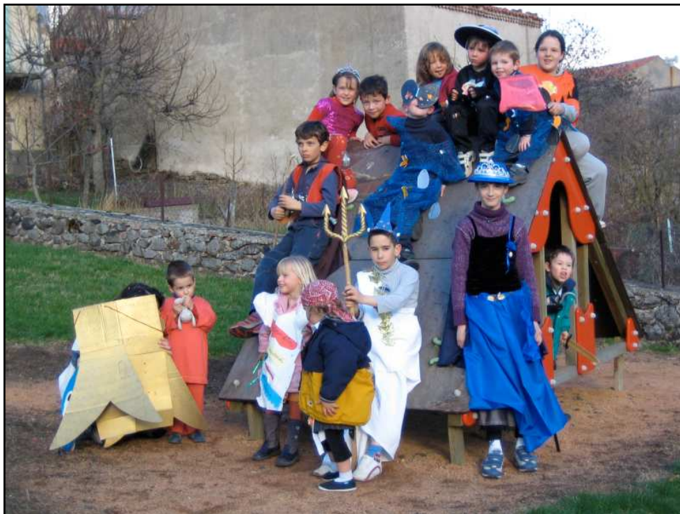
Le carnaval des enfants

De janvier à août 2006, Olloisirs a organisé les activités suivantes :