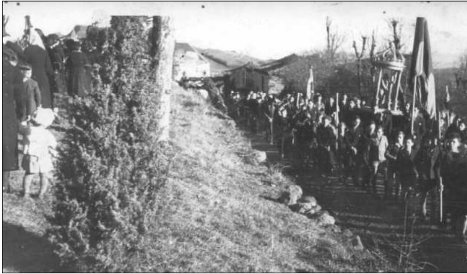
La procession St Jean Baptiste en juin 1944