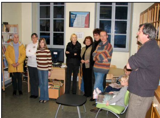
Inauguration de la médiathèque le 7 mars 2006